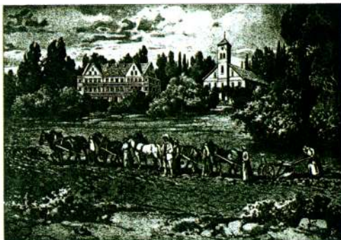
חורשים במחרשת העומק עם עשר בהמות "בביר-סלים".