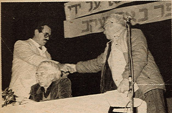
ערב אימוץ קהילתי וילנא