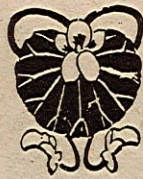
ערב ראינות במתנ"ס

טכום חגיגות הקיץ. במסגרת ארועי חגיגות הקיץ, הופיעה לסכום הארועים הזמרת האהודה והמפורסמת עופרה חזה. הופעתה המרשימה השאירה ציבור רחב של תושבים מרוצים מכל שכבות הגיל. הצלחתה הרבה נבעה מהיחס החם והלבבי שהרעיפה עופרה חזה לכל עבר והביאה לנו ערב מהנה ובלתי נשכח.